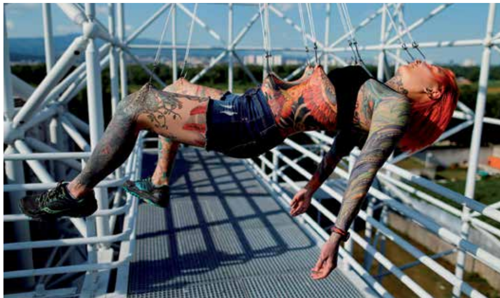
ZAVĚSIT SE. Na háky se lidé věší nejen kvůli sexuálnímu vzrušení, ale i pro téměř transcendentální pocity, jež u toho zažívají.